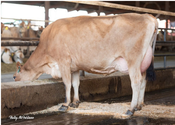
JX PROGENESIS MINNIE {5} DAM